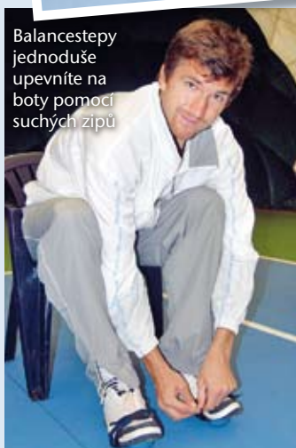
Balancestepy jednoduše upevníte na boty pomocí suchých zipů

"Balancestep se s velkým úspěchem užívá právě při nácviku reakční schopnosti organismu na proměnlivosti terénu, kde se člověk může pohybovat. I nesportovec tak častým "balancováním" připravuje rychlou podvědomou reakci těla na překážku. Tím se chrání před svalovými zraněními, zejména úrazy zad, kolen a kotníků," uvádí Dr. Václav Mareš, zatímco mě učí balancovat. Snažím se udržet - i přes nevhodnou obuv - špičku i patu chodidla nad zemí a držet rovnováhu. Přitom se dozvídám, že pravidelné po-