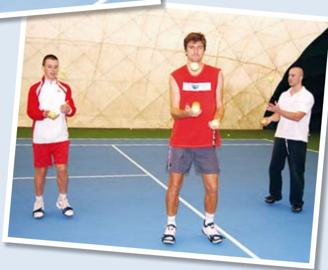
Různé hry ve spojení s Balancestepy představují "zdravou zábavu" a zpestření tréninků

Ve vrcholovém sportu je již Balancestep doceněn. Jako komplexní a široce uplatnitelnou novinku ho využívají špičkoví trenéři, lékaři i rehabilitační specialisté. Ovoce přináší hlavně u sportů s velkými nároky na rovnováhu, dynamiku a frekvenci dolních končetin. Což je základ nejen sportovních her, tance, baletu, atletiky, jezdeckví, sjezdového lyžování a tenisu, ale téměř každého sportu.